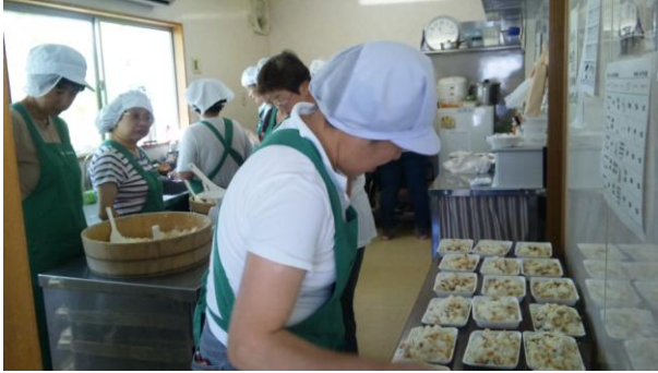
上 朝から皆、準備に余念がありません

…どうせなら、と7月8月9月生まれのなかまの『誕生会』も相乗りすることになり、前日から、なかまたちが皆の大好きなゼリーを特大サイズで作り 準備しました。