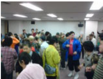
ひょうご作業所祭 きぎょうしょまつ