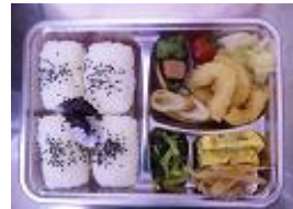
450 円 (日替弁当大)