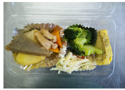
150 円 (おかず)