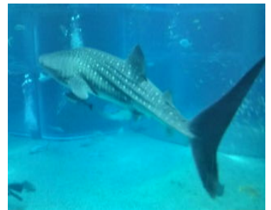
姫路作業所連絡会交流会 ひめじぎょうしょれんらくかいこうりゅうかい