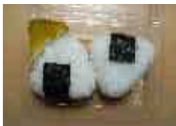
150 円(おにぎり 2ヶ)