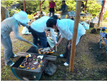
バーベキュー：鹿が壺 しか つぼ