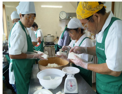
おにぎり出来るよ！ おにぎり事業