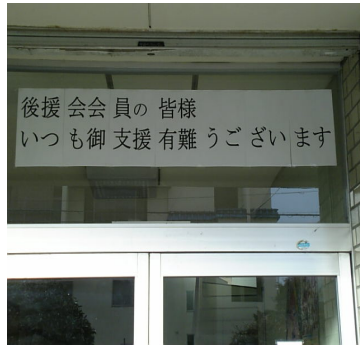
後援会感謝デー：東延末公民館 こうえんかいかんしゃ ひがしのぶすえこうみんかん