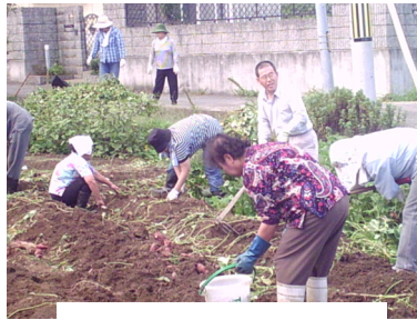
はたけさぎょう 畑作業