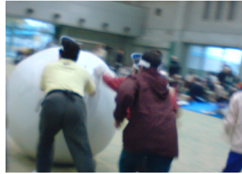
ジョイフルスポーツ：港ドーム