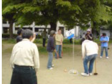
グランドゴルフ：東延末公園 ひがしのぶすえこうえん