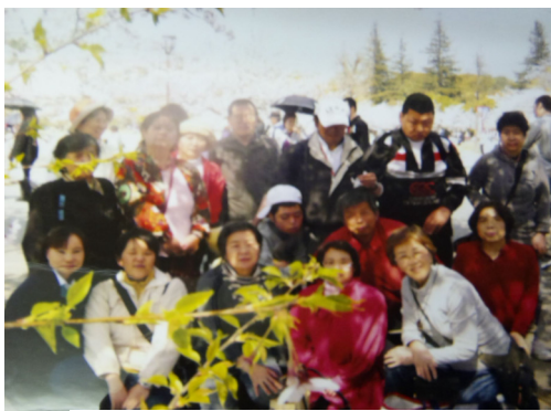
全員集合！ 姫路城にて花見

私達は、社会参加と自立を目標に掲げ、当作業所の理念である「共に生きる」を目指しております。どうか、私たちの願いに温かいご支援をお願いいたします。