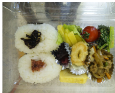
300 円 (日替弁当中)