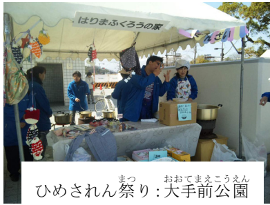
まつ おおてまえこうえん ひめされん祭り：大手前公園